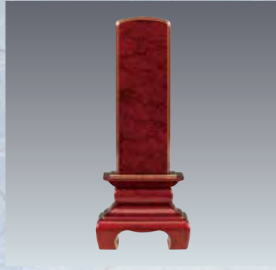
11 本甲丸 さざれ波 深紅