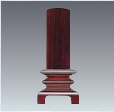
13 紫檀呂門型(黒檀製もあり)