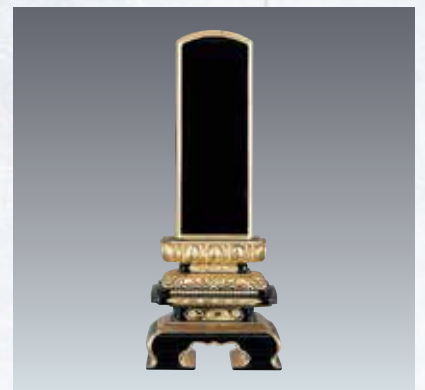
9 面粉千倉座型 ※受注生産