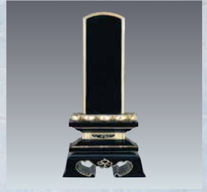
3 極上蓮華付春日型