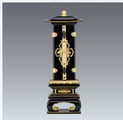
17 みやび回出 面粉