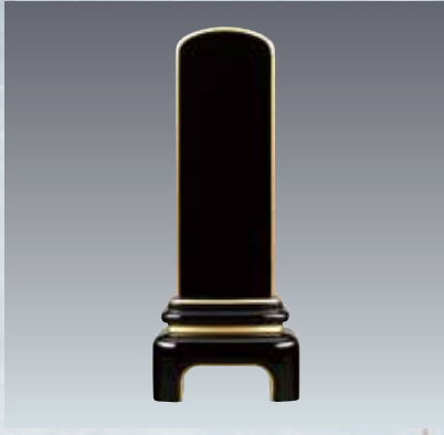
10 モダン 呂色