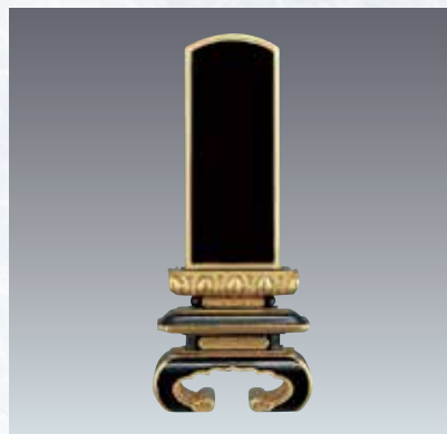
8 面粉京中台型 ※受注生産