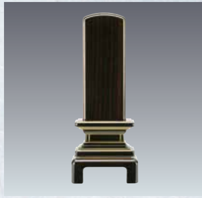
14 京霞 漆黒檀(紫檀製もあり)